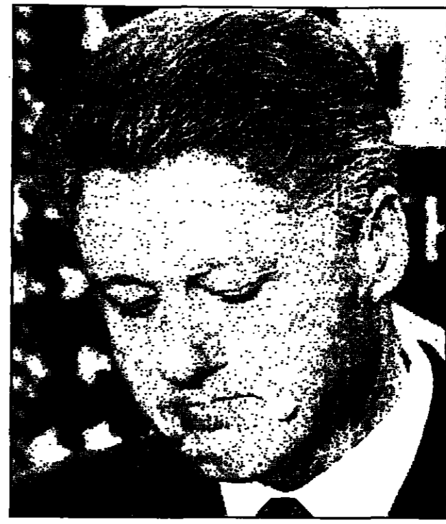
واشنطن - «القدس العربي» - من محمد دلبح

يرى محللون وخبراء في شؤون السياسة الخارجية الأمريكية أن جهود أعمال الرئيس الأمريكي بيل كلينتون على السعي الدؤوب في أعقاب الانتخابات التشريعية التي جرت الأسبوع الماضي وأسفرت عن تحقيق نجاحات طافية لصالح حزبه الديمقراطي، لا يزال يتطلع الى عمل درامي، ويتساءل هؤلاء عما يمكن توقعه في السياسة الخارجية الأمريكية خلال العامين اللذين لفترة حكم الرئيس كلينتون، وما الذي ستعكسه حكومته بخصوصها في الألفية الجديدة، مبرزة وبخاصة في علاقات الولايات المتحدة مع بقية العالم.